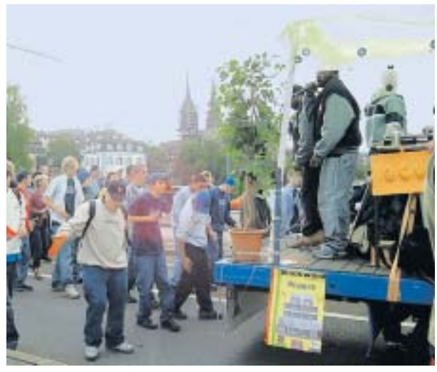
Beatmobiles auf der Wettsteinbrücke.

Beat on the Street. Sa, 20.8. ab 17.30 Uhr. Münsterplatz, Basel. www.beatonthestreet.ch