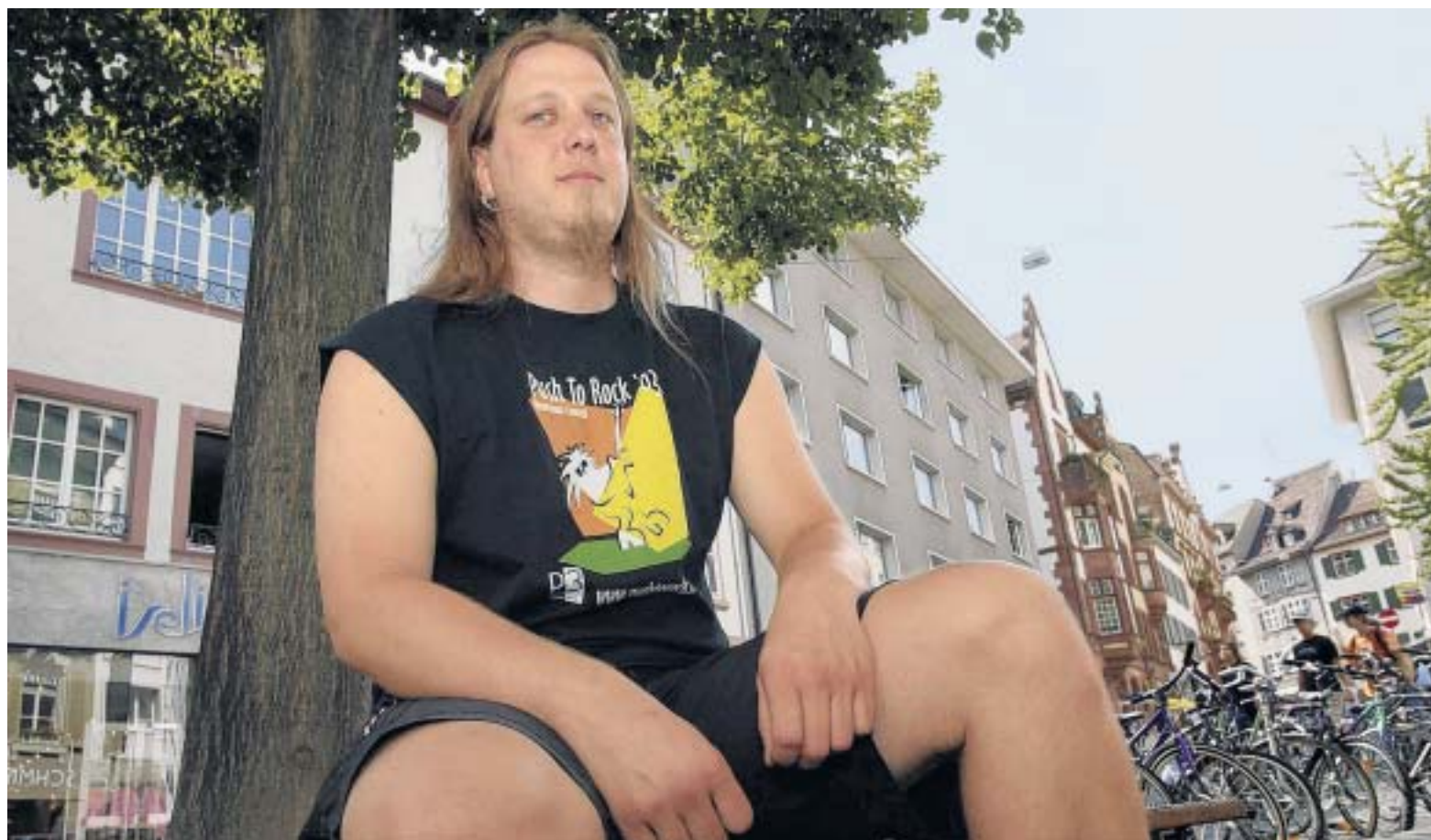
Noch ist er gelassen, aber spätestens heute Freitag beginnt für «Vonky» der Openair-Stress.

Der Booking-Manager vom Openair Waldenburg rennt für Extrawünsche.